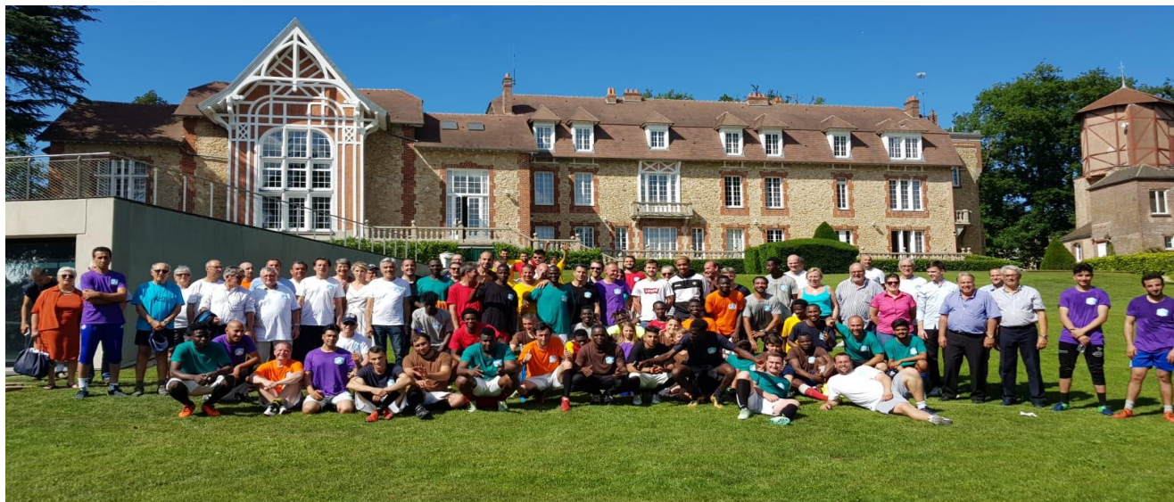
Rassemblement dans le cadre du projet Footballeurs Citoyens

Les leviers financiers sont à consolider en plus de l'écriture d'actions types dont les acteurs de la puissance publique pourraient s'emparer pour en devenir partenaires. En tant qu'acteur tête de réseau national, nous devons nous assurer que le football est bien identifié comme un levier d'inclusion important dans un parcours d'intégration.