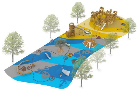
Playgones – aire de jeux pirates et océan

Aujourd'hui, la question de l'espace ludique et sportif est posée en amont du projet global et devient centrale dans l'aménagement d'un quartier. Là où il y a quelques années, l'aire de jeux, le plateau sportif étaient intégrés en fin de projet, aujourd'hui les promoteurs et les architectes les définissent à la base.