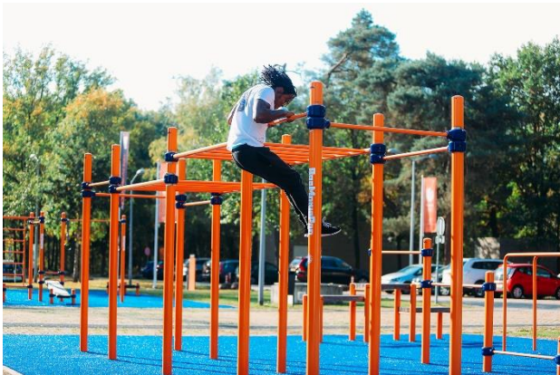
Playgones – aire de street workout

Le street workout, apparu il y a moins d'une décennie, a trouvé sa place dans la plupart des communes Françaises, les pumptracks sont en phase d'expansion, les aires d'entraînement au parkour vont suivre. Ce sont quelques exemples, on peut également citer le Handball à 4, le foot à 5, le basket 3x3 et une multitude d'autres sports.