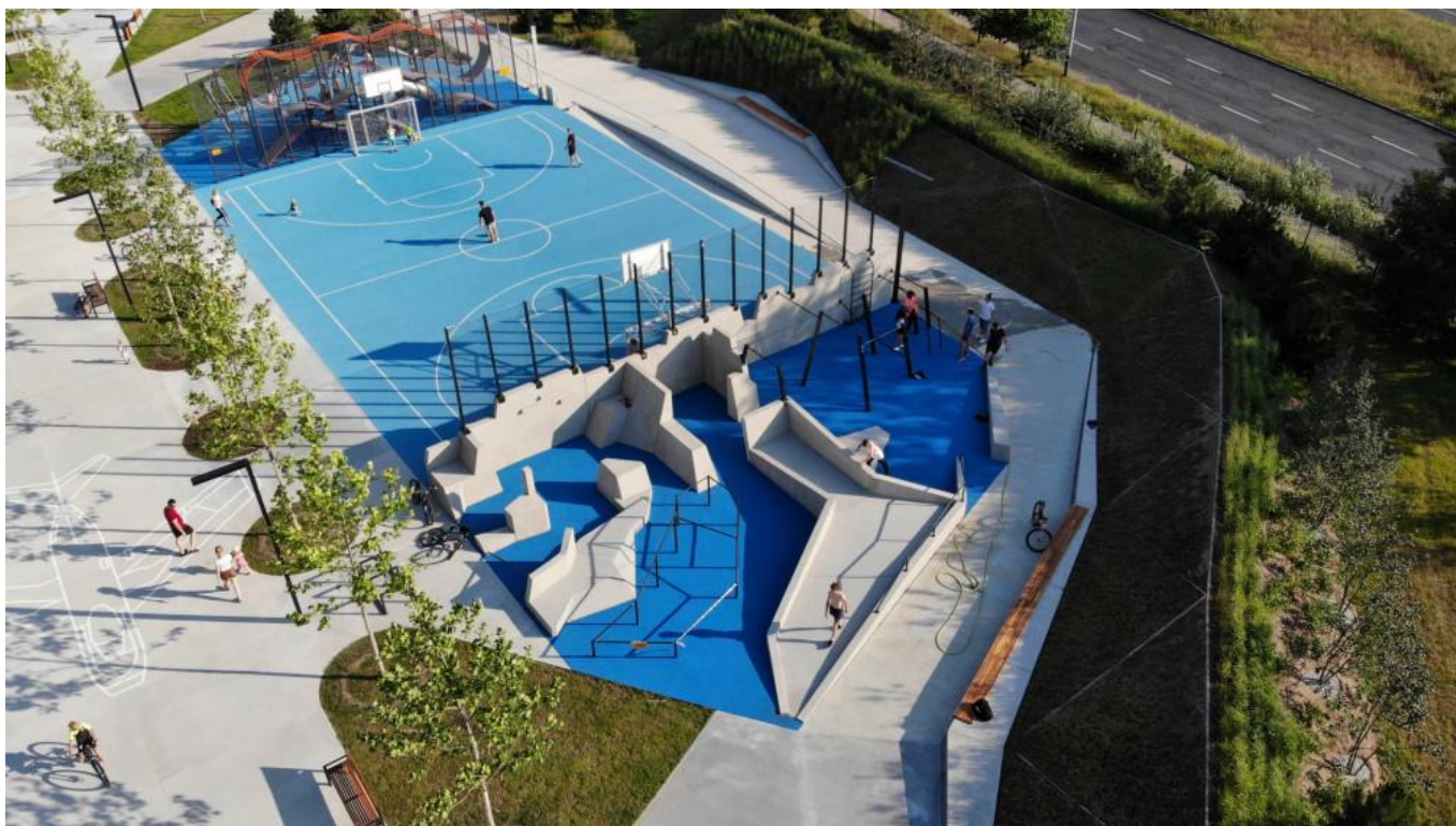
Playgones – Aire sportive parkour – TMS – aire de jeux