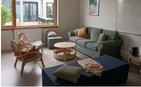
La tisanerie réaménagée

Les internes sont encadrés par 2 responsables d'internat et 12 assistants d'éducation.