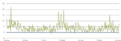
Statistiques des abonnés

Une forte augmentation de la visibilité et une fidélisation des abonnés !